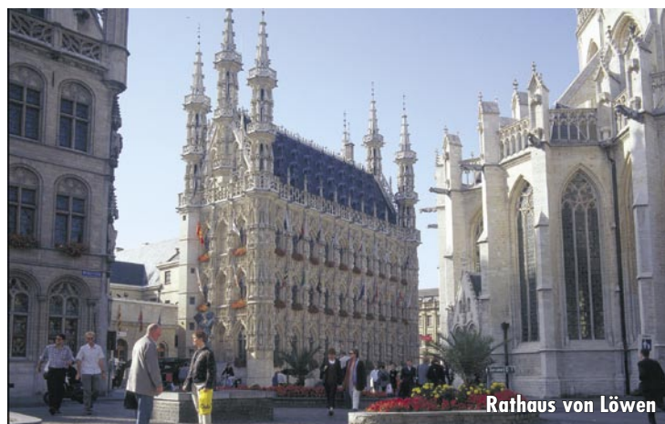
Rathaus von Löwen

Heute begleitet Sie der Reiseleiter nach Löwen, weltberühmt durch die 1425 gegründete Katholische Universität, die eine der bedeutendsten Hochschulen Europas